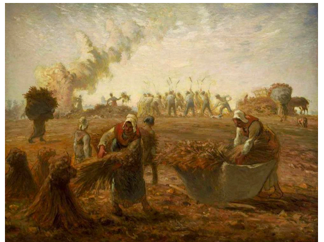
Jean-François Millet (II) - Buckwheat Harvest - Summer