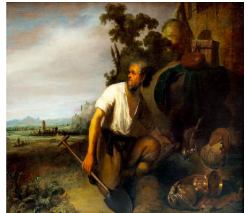
The Parable of the Hidden Treasure, Rembrandt Harmenszoon van Rijn