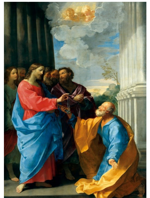
Guido Reni: Christ Giving The Keys to St. Peter