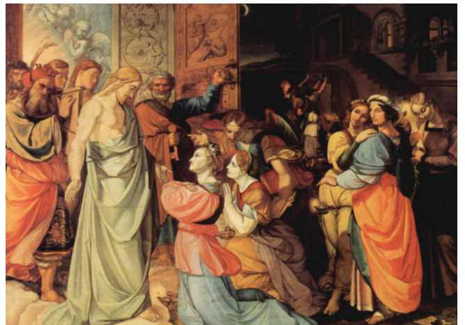
The Wise and the Foolish Virgins by CORNELIUS, Peter