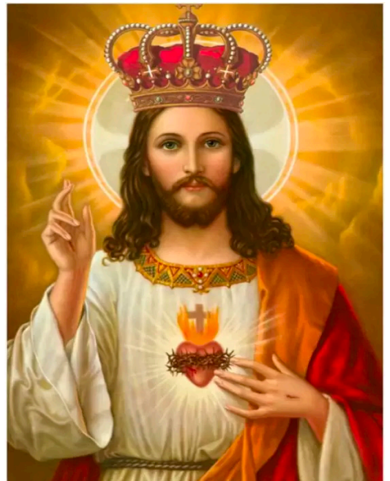
The Solemnity of Our Lord Jesus Christ, King of the Universe