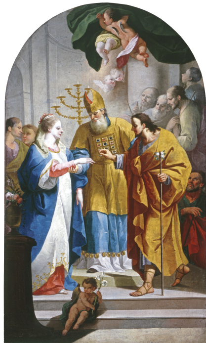
The Marriage of the Virgin: Anton Cebej