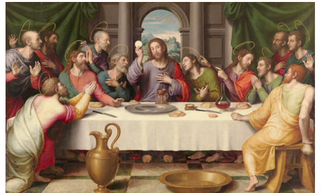
The Last Supper: Museo del Prado