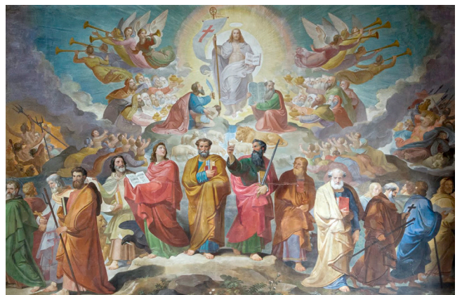
Mission of the Apostles: Tommaso Minardi