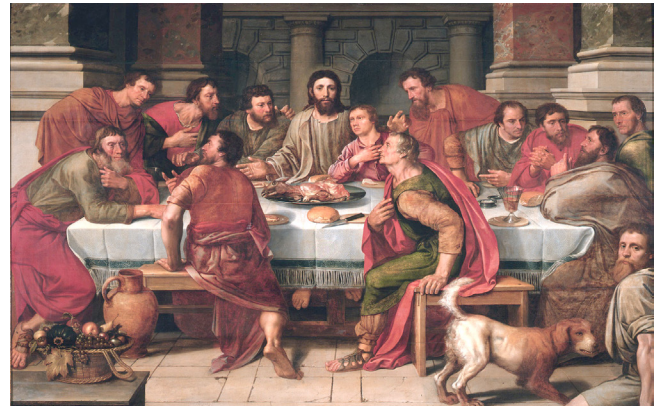
Last Supper : Willem Key