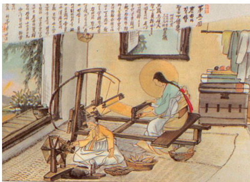
노모인 김썸 / 성녀 정정혜 엘리사벳(1797 생 1839. 12. 29 향수) 성녀는 명문가의 후손으로 교회를 빛낸 순교자이다. 동정녀로 김썸을 하여 동생 성 정하상의 뒷바라지를 하였다.