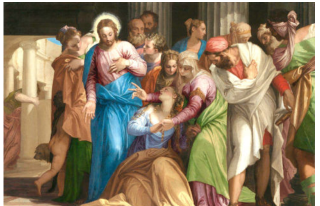
The Conversion of Mary Magdalene: Paolo Veronese