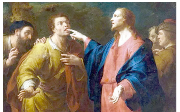
Domenico Maggiotto: Christ Healing a Deaf and Mute Man