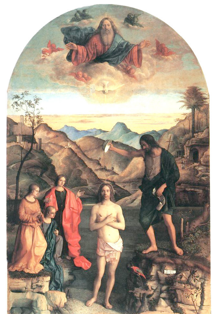
Giovanni Bellini: The Baptism of Christ, The St. John Altarpiece