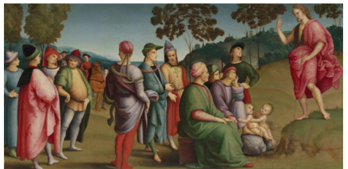
Raphael | Saint John the Baptist Preaching