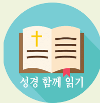
성경 함께 읽기

“너희가 주 너희 하느님의 말씀을 잘 듣고, 내가 오늘 너희에게 명령하는 그분의 모든 계명을 명심하여 실천하면, 주 너희 하느님께서 땅의 모든 민족들 위에 너희를 높이 세우실 것이다. 너희가 주 너희 하느님의 말씀을 잘 들으면, 이 모든 복이 내려 너희 위에 머무를 것이다. 신명기 28:1-2