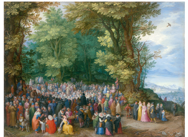
"The Sermon on the Mount" by Jan Brueghel the Elder