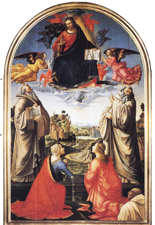
Christ in Heaven with Four Saints and a Donor by Domenico Ghirlandaio